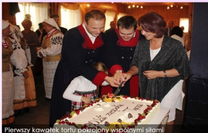
Pierwszy kawałek tortu pokrojony wspólnymi siłami