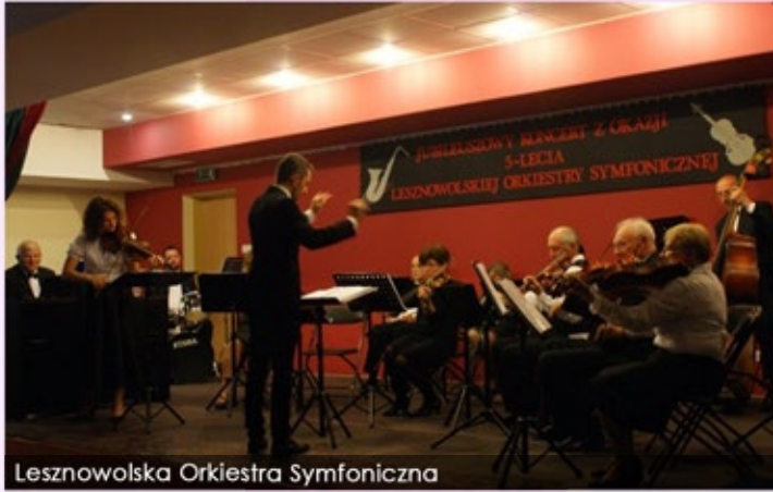
Lesznowska Orkiestra Symfoniczna