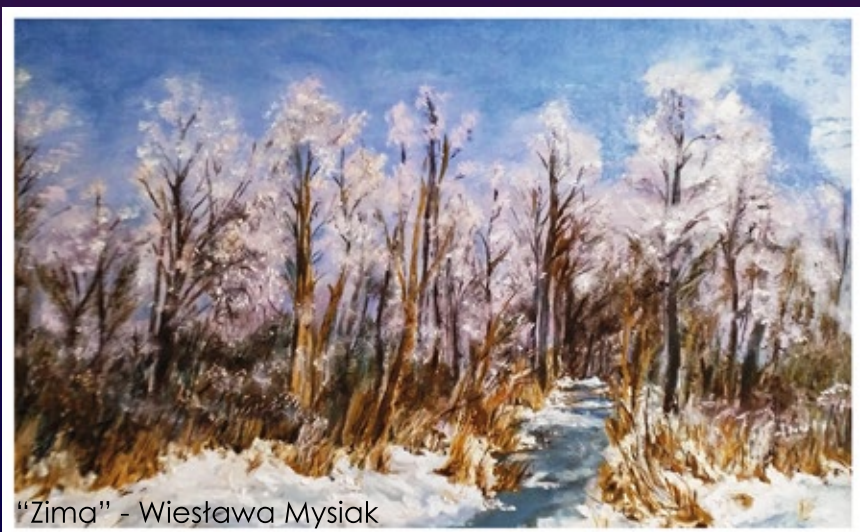
"Zima" - Wiesława Mysiak