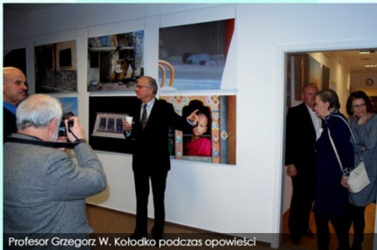
Profesor Grzegorz W. Kołodko podczas opowieści

W niedzielne popołudnie 27.11.2016 r., tuż przed godziną 17.00 sala teatralna siedziby Gminnego Ośrodka Kultury w Lesznowoli zapelniała się, a wernisażowi goście zajmując miejsca, przeglądali z zainteresowaniem folder wystawy. Ozdobiony barwnymi fotografiami korytarz Galerii OKNO zachęcał wielu gości jeszcze przed oficjalnym otwarciem wystawy do obejrzenia dużych, różnorodnych i niezwykle ciekawych prac zacnego i znanego na całym świecie mieszkańca gminy Lesznowola, pana prof. Grzegorza W. Kołodko.