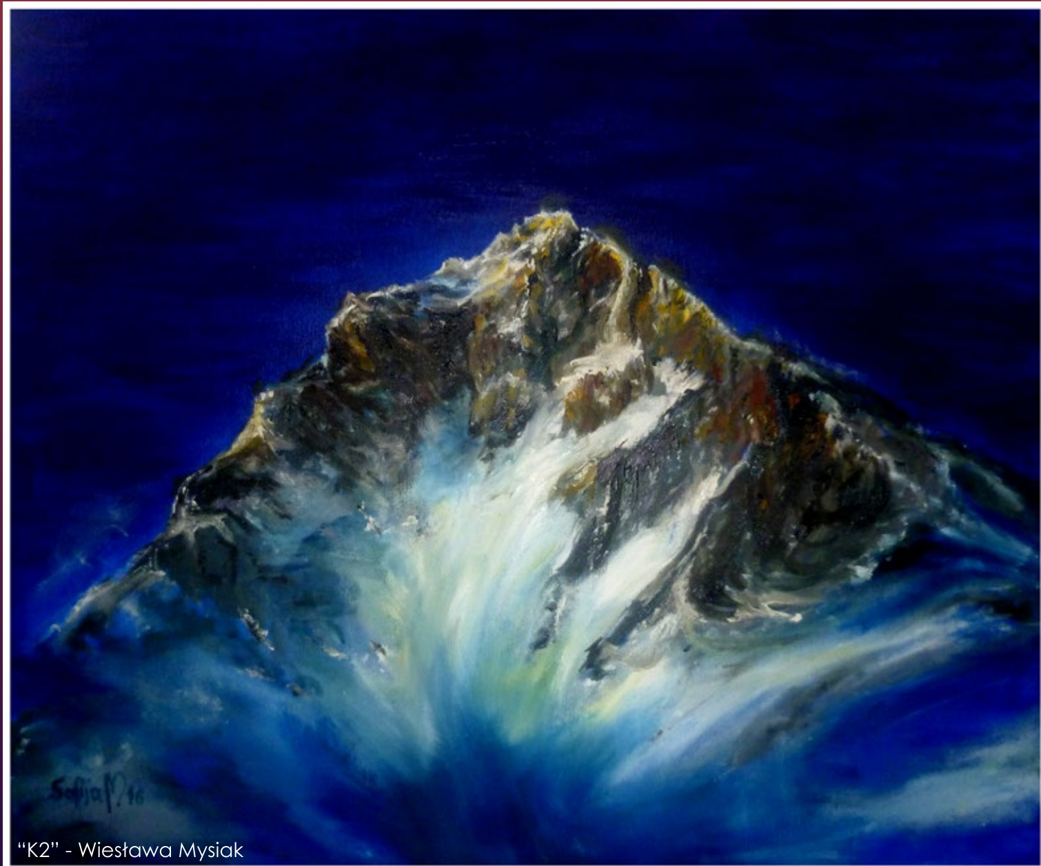
"K2" - Wiesława Mysiak