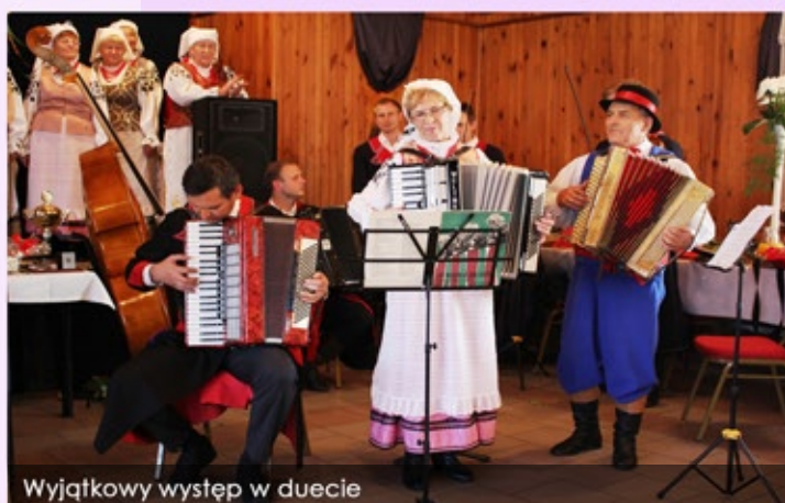
Wyjątkowy występ w duecie